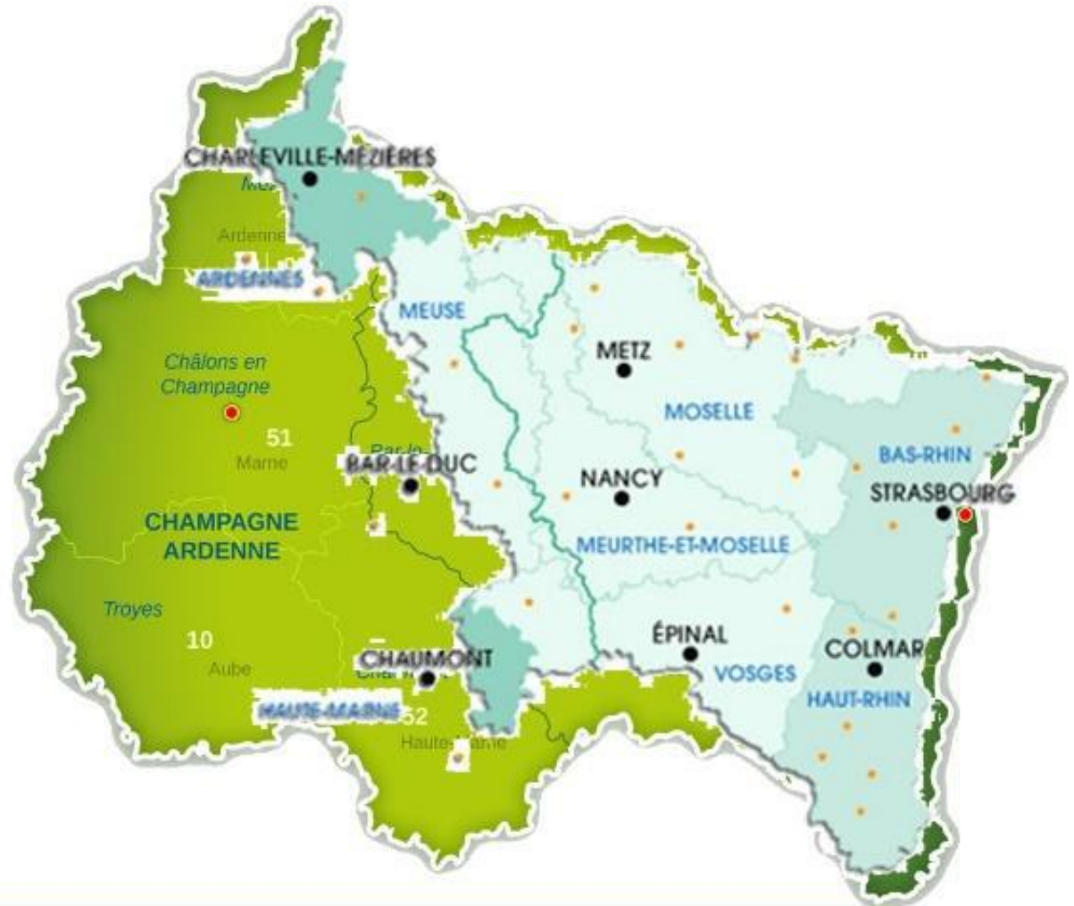
Superposition de la nouvelle Région et du bassin