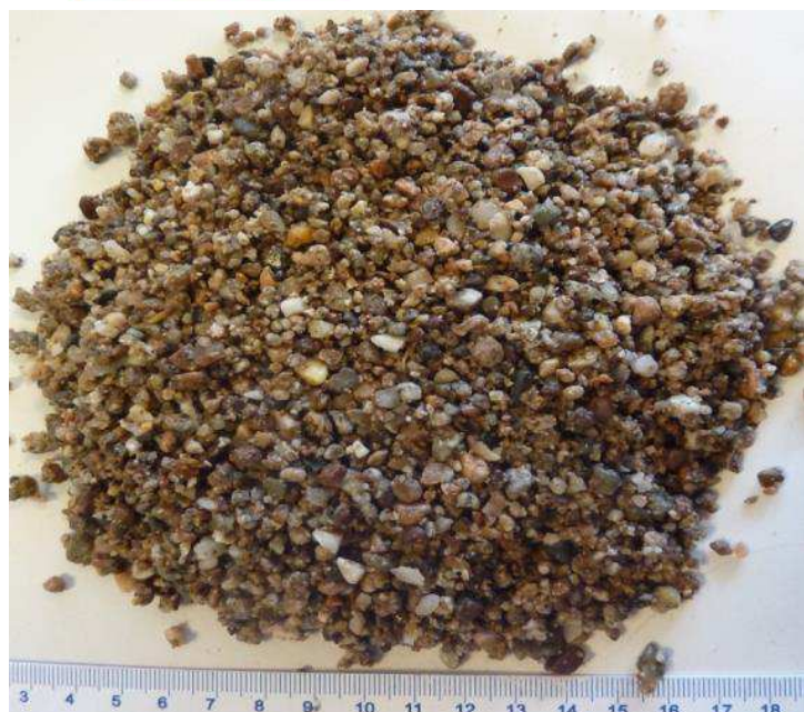
Granulats « roulés »