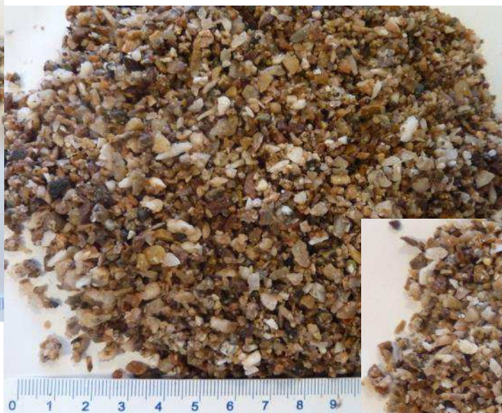
Granulats « concassés »