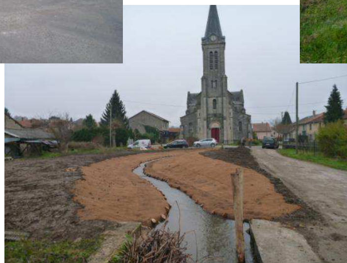
Ruisseau de Marbotte (traversée de Mécrin – CC DU PAYS DE COMMERCY - 55)