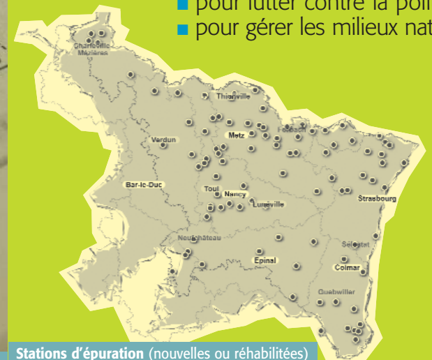
Stations d'épuration (nouvelles ou réhabilitées) mises en service au cours du 8 ème programme (2003 > 2006) avec l'aide de l'agence de l'eau